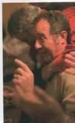
Après le marché, ambiance truffe et guinguette à l'auberge du village en compagnie de la confrérie des trufficulteurs.